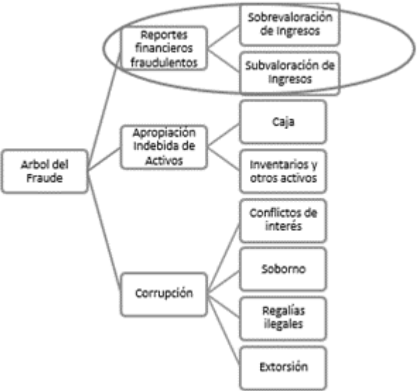
Figura 1. Categorías de Fraude Ocupacional.

Cabe señalar que la presente investigación se orienta hacia las acciones necesarias para la prevención del fraude sobre los reportes financieros, por lo tanto, el estudio no está referido a las demás categorías como son la apropiación indebida de activos ni la corrupción. La prevención, por su parte, se encuentra en la primera fase del proceso de gestión de riesgo del fraude, es decir previo a la detección y a la investigación.