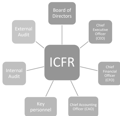
Figura 3. Roles claves asociadas al Control Interno sobre los Reportes Financieros (ICFR por sus siglas en inglés).

Por su parte y más allá del papel general de los directores en la fijación del TATT, los cambios recientes en las leyes y en la práctica están ampliando sus responsabilidades para los programas de cumplimiento corporativo y ética de las empresas, como ha señalado Schwartz et al. (2005). Esta responsabilidad es indudablemente transmitida al resto de la organización y hacia sus Roles y Responsabilidades claves (ver Figura 3).